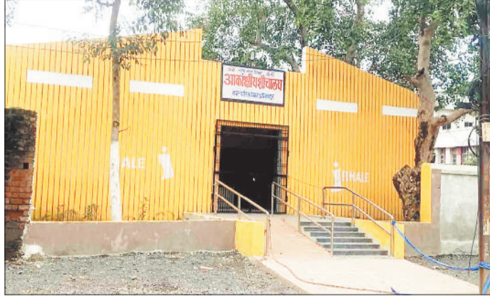
पुराना बस स्टैंड में नवनिर्मित शौचालय।