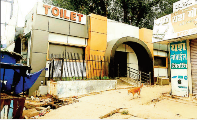
पुराना बस स्टैंड में मरम्मत किया गया पुराना शौचालय।