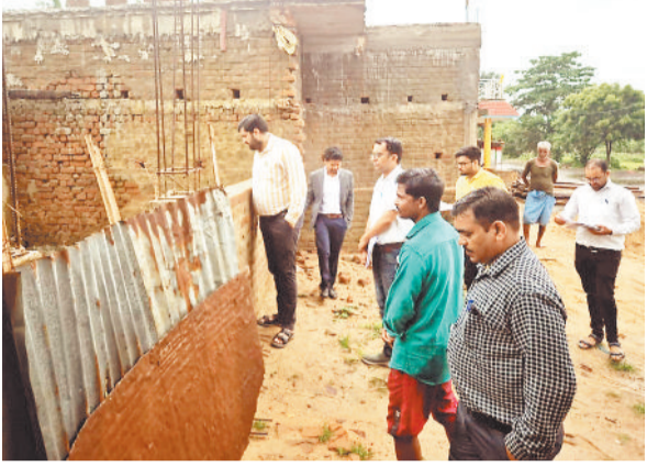
निरीक्षण करते सीईओ।

अपने निरीक्षण भ्रमण में उन्होंने ग्राम पंचायत तेंदुआ और सोरगा के कुछ प्रधानमंत्री आवास योजना के प्रगतिरत कार्यों की गुणवत्ता का अवलोकन किया साथ ही ग्राम पंचायत तेंदुआ के ग्राम पंचायत भवन में प्रधानमंत्री आवास योजना के हितग्राहियों से चौपाल लगाकर संवाद किया। उन्होंने सभी हितग्राहियों से उनकी आवास निर्माण प्रगति पर चर्चा की और आवश्यक सुझाव दिए। यहां प्रधानमंत्री आवास योजना ग्रामीण के हितग्राहियों को संबोधित करते